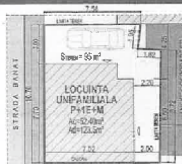
DETALIU PLAN REGLEMENTARI